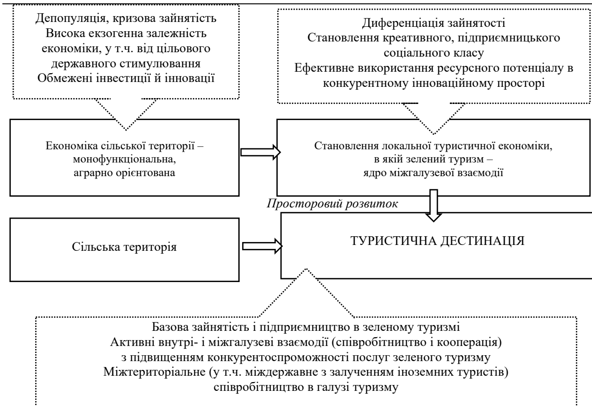
Рис. 2. Сільська територія як основа для становлення локальної туристичної економіки з ядром зеленого туризму

Висновок. Сільські території включають поселення сільського типу, території між сільськими поселеннями без ознак міської забудови і виробництва, а також території сільськогосподарського виробництва. З огляду на специфіку ресурсного потенціалу, сільські території тяжіють до монофункціональності з агроспеціалізацією. Останніми роками в умовах світового туристичного буму все більше зусиль у розвитку сільських територій докладається для підтримки в них туристичних видів економічної діяльності. Зелений туризм має безліч аргументів на користь розвитку в сільських ареалах. Він забезпечує перехід на поліфункціональність локальної економіки та, водночас, не допускає надмірних антропогенних навантажень на довкілля.