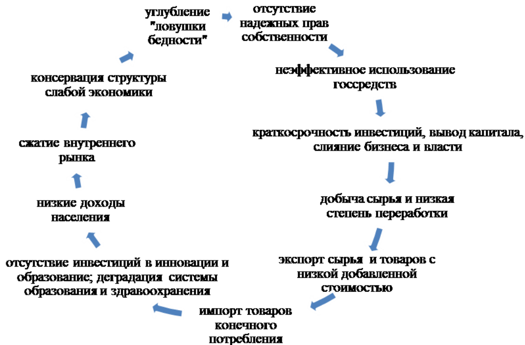
Рис. 2. Схема погружения страны в «ловушку бедности», разработка автора

Сегодня абсолютно очевидно, что Украина всё глубже погружается в «ловушку бедности», представляющей своеобразный замкнутый круг, характерный для стран Африки и Юго-Восточной Азии с их экономическим ростом +1,5-2 %, со всеми вытекающими последствиями (рис. 2).