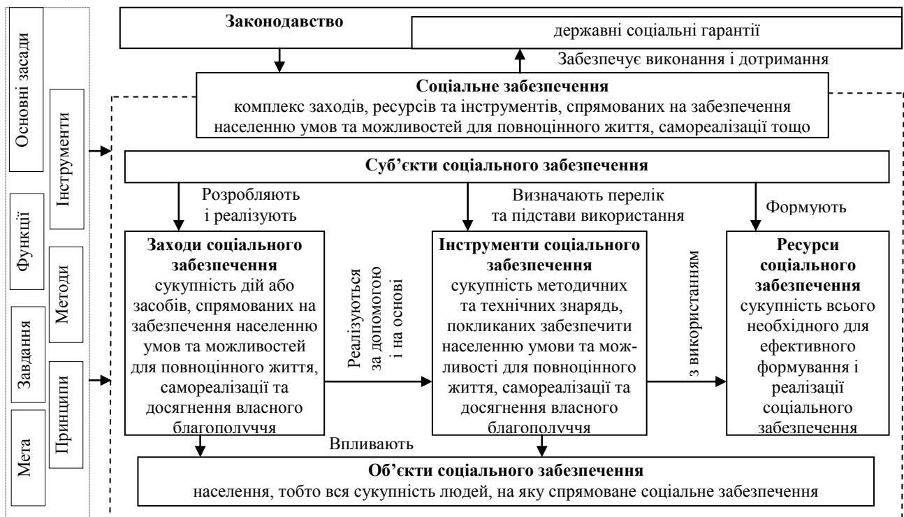
Рис. 2. Державне соціальне забезпечення в механізмах реалізації соціальної політики*

Наступна важлива складова досліджуваного механізму – державне соціальне забезпечення. По суті, процес державного соціального забезпечення сам по собі також є механізмом. Окремі елементи механізму державного соціального забезпечення вже розглядалися нами раніше, а тому акцентуємо нашу увагу на тих моментах, які ще не досліджувалися. Зокрема, представимо побудовану нами структуру означеного механізму на рис. 2.