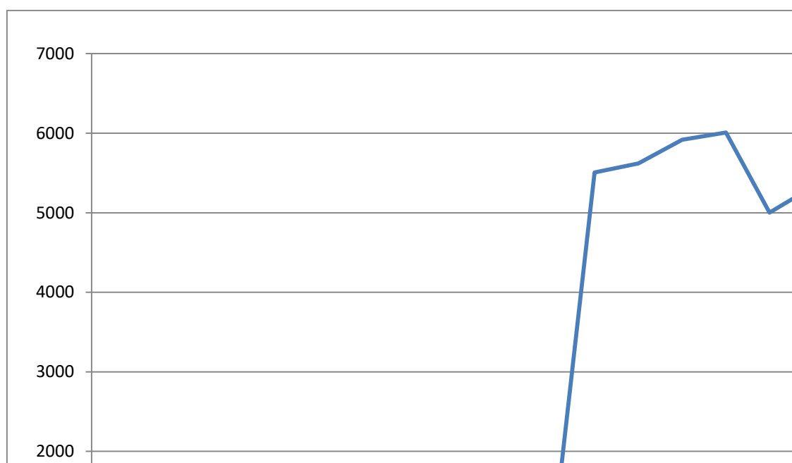
Рис. 1. Обсяги ПІІ з ФРН до України в період (млн дол. США)

Порівняння динаміки надходження ПІІ з ФРН із загальними обсягами надходження ПІІ в Україну наочно видно з графіків на рис. 1 і 2, що побудовані на основі даних таблиці 1.