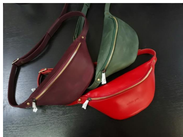
Рис. 4. Візуалізація виробів проекту

Зразки піддавалися експериментальним випробуванням на фізико-механічні характеристики, що підтвердили високі показники якості і комфортності виробу [14–18]. Зроблена спроба удосконалення базового технологічного процесу за рахунок використання методик ручної корекції деталей.