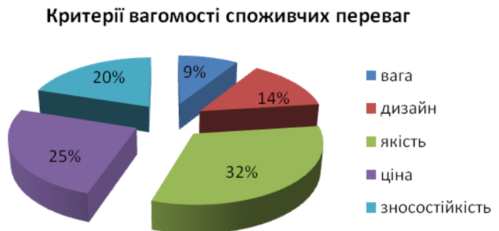
Рис. 2. Критерії вагомості споживчих переваг

На основі ескізного проекту, який складався з фор-ескізів та творчого пошуку раціональної форми і розмірів даної розробки, сучасних моделей і їх кольорової гами було розроблено робочі креслення обраної моделі та деталювання (рис. 3), підібрано і описано групи матеріалів, описано поетапний технологічний процес виробництва виробів. За результатами дослідження виготовлено дослідні зразки виробів (рис. 4).