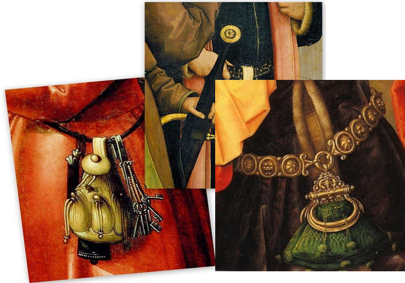
Рис. 1. Візуалізація поясних сумок «омоньєрів» епохи Відродження

Відродження. Це по суті був звичайний підвісний гаманець, який мав назву «омоньєр» (рис. 1) [2–9].