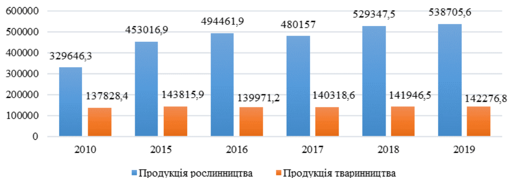
Рис. 3 Продукція сільського господарства у 2010-2019 рр. (у постійних цінах 2016 р.), млн грн

Значну частку продукції сільського господарства займає продукція рослинництва, а саме у 2019 р. – 79% вартості всієї продукції сільського господарства (рис. 3).