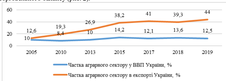
Рис. 2 Частка аграрного сектору в експорті та у ВВП України у 2005–2019 рр., %

Аграрний сектор є одним з провідних та стратегічно важливих секторів економіки України. Він формує 14 % ВВП країни, частка експорту аграрної продукції в загальній структурі експорту України складає близько 40 %, а також АПК – основне джерело надходження валюти в Україну та ключовий фактор у підтриманні торговельного балансу (рис. 2).