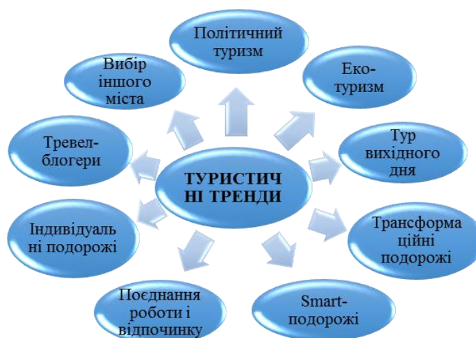
Рис. 2. Туристичні тренди 2020*

В останні десятиліття істотно зростає кількість людей, які обирають подорожі як вид відпочинку. Як зазначає тревел-гід Big Seven Travel, за останні десять років кількість мандрівників за рік пододало позначку в 1 млрд осіб [5]. Виділяють ряд трендів, які визначатимуть уподобання туристів у 2020 та наступних роках (рис. 2).