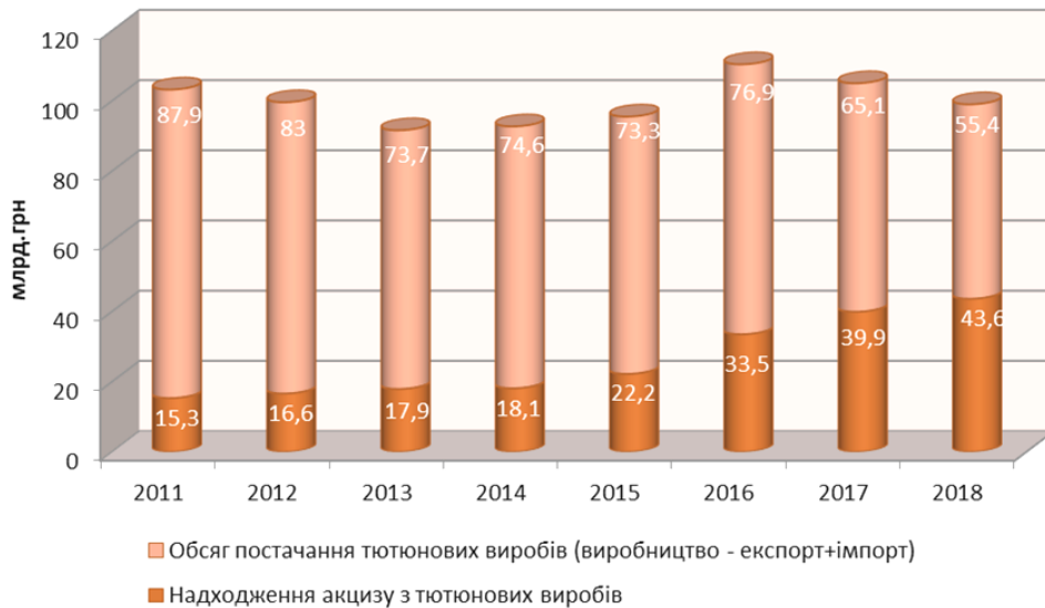
Рис. 1. Надходження акцизного податку пf обсяги реалізації (постачання) тютюнових виробів, млрд грн

У 2018 році частка акцизного збору у ВВП зменшилась на 0,4 процентного пункту порівняно з попереднім роком через зменшення частки палива, тютюнових виробів, алкогольних напоїв та інших товарів на 0,1 процентного пункту для кожної групи (рис. 2).