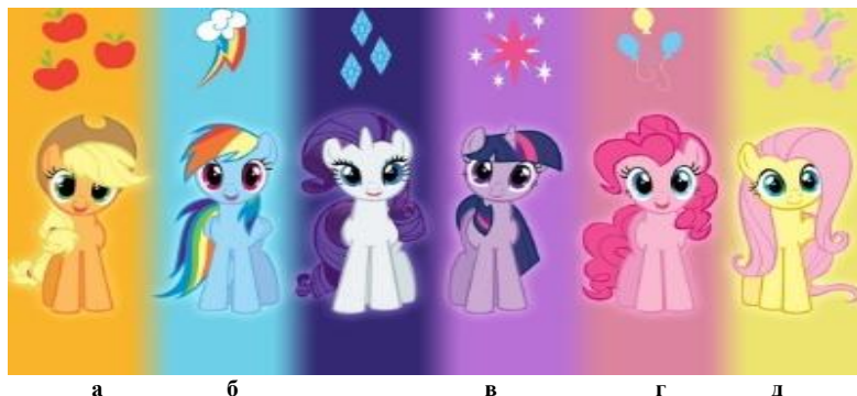
Рис. 1. Головні герої анімаційного серіалу «My Little Pony»: а – Епплджек, б – Рейнбоу Деш, в – Твайлайт Спаркл, г – Пінкі Пай, д – Флаттершай

Таким чином, усвідомлюючи величезну роль рольових ігор у розвитку дітей та бажання дітей одягатися в одяг костюмованого формату, розв'язувалась задача створити оригінальний, зручний у повсякденному використанні одяг, але в якому діти могли би перенестися у свій світ мрій. На основі дослідження казкової героїки анімаційного серіалу «My Little Pony» здійснено дизайн-проекування колекції одягу костюмованого формату [8]. Джерелом натхнення для створення моделей колекції стали головні герої з дитячого мультсеріалу (рис. 1).