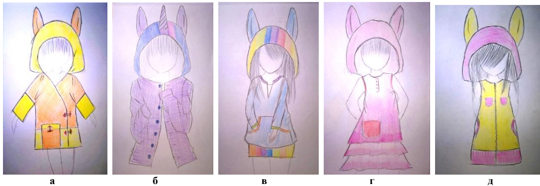
Рис. 2. Колекція трикотажних дитячих виробів за мотивами мультиплекційного серіалу «My Little Pony»: а – кардиган «Епплджек», б – кардиган «Гвайлайт Спаркл», в – худі «Рейнбоу Деш», г – сарафан «Пінкі Пай», д – сарафан «Флаттершай»

В ході розробки моделей колекції проведено аналіз форм та колористичної гами образів головних героїв анімаційного серіалу. Розроблені моделі мають назву, що відповідають назвам головних казкових героїв (рис. 2).