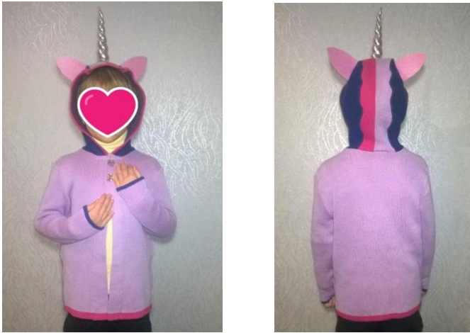
Рис. 3 Фото промислового зразка модель «Твайлайт Спаркл»

У якості промислового зразка розроблено та виготовлено модель дитячого кардигану «Твайлайт Спаркл» з покращеними споживними властивостями. Кардиган трикотажний дитячий, призначений для дітей ясельної та дошкільної вікових груп. Джемпер виконаний з пряжі бамбукової лінійної густини 29×2×2 текс та бавовняної 25×2×2 текс на плоскофанговій машині «Brother» 6 класу подвійним неповним жакардовим переплетенням. Зовнішній вигляд джемперу дитячого характеризується наступними суттєвими ознаками: