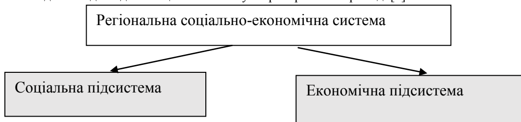
Рис. 2. Структура регіональної соціально-економічної системи

Запропоновано до першої (соціальної) підсистеми віднести установи і організації, що мають державне фінансування, або знаходяться на самофінансуванні, і за видами економічної діяльності розділені на державне управління, освіту, охорону здоров'я, соціальну допомогу та ін. Основна їх діяльність спрямована на надання відповідних соціальних послуг територіальній громаді [5].