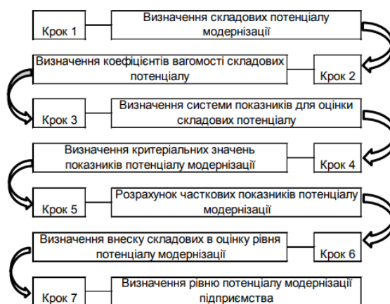
Рис. 4. Послідовність здійснення бальної оцінки потенціалу модернізації підприємства за Бойко О.С. [9]

Висновки. В статті проведено дослідження сутності та методичного забезпечення оцінювання модернізаційного потенціалу економічних систем. Аналіз теоретичного базису показав проблематику недостатності наукових досліджень щодо управління й оцінювання модернізаційного потенціалу підприємства. Розглянуті методики аналізу рівня глибини, розвитку та інтегрованості елементів модернізаційного потенціалу розкривають можливості для проведення подальших наукових пошуків щодо обґрунтування власних науково-методичних положень діагностики модернізаційного потенціалу з урахуванням тенденцій інноваційного розвитку та специфіки підприємств інфраструктурної сфери.