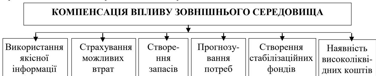
Рис. 1. Формування інструментів захисту підприємств від потенціальних загроз впливу зовнішнього середовища

Фактор невизначеності можна назвати одним з ключових факторів, обмежуючих розвиток економіки у довгостроковій перспективі. Непередбачуваність і неоднозначність впливу зовнішнього середовища примушує для підвищення конкурентоспроможності і економічного зростання підприємств проводити ряд адаптаційних заходів. Формування інструментів компенсації впливу зовнішнього середовища на діяльність підприємств наведено на рис. 1.