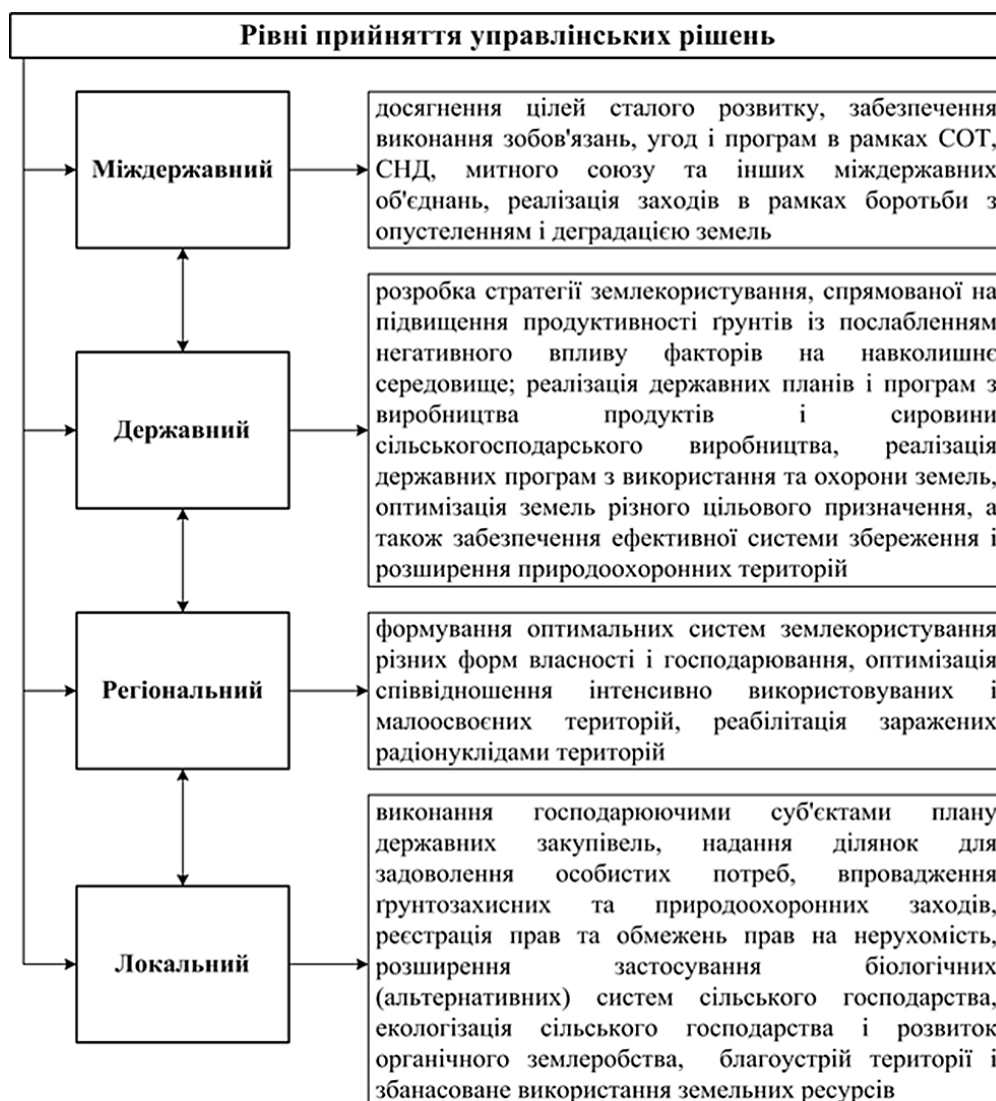
Рис. 2. Рівні прийняття рішень щодо формування еколого-економічних територіальних систем на засадах сталого розвитку

Висновки. Оцінка майбутнього ефекту від запровадження нового типу стратегії сталого розвитку землекористування України і, як наслідок, забезпечення повного освоєння та розвитку стратегічного потенціалу економіки, підвищення її ефективності, рейтингу конкурентоспроможності країни та інноваційної здатності відновлення базової системи державного управління до початкового стану з одночасною генерацією нової її структури та визначенням цільових функцій підсистем з активізацією виробничої й інноваційної діяльності в контексті забезпечення економічної рівноваги, удосконалення механізмів реалізації стратегії сталого розвитку України.