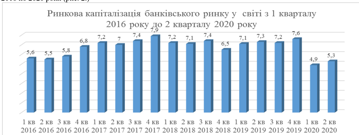
Рис. 2. Ринкова капіталізація банківського сектору у всьому світі 2016-2020

Далі представлено статистичні дані щодо ринкової капіталізації ринку банківських послуг у світі з 2016 по 2020 роки (рис. 2.)