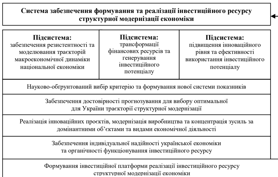
Рис. 2. Блок-схема структури системи забезпечення формування та реалізації інвестиційного ресурсу структурної модернізації економіки України*

економіки. Під інвестиційним ресурсом структурної модернізації економіки розуміємо систему специфічних елементів, яка здатна забезпечувати самоорганізацію регульованої системи управління. Система забезпечення формування та реалізації інвестиційного ресурсу структурної модернізації економіки включає три основні підсистеми (рис. 2).