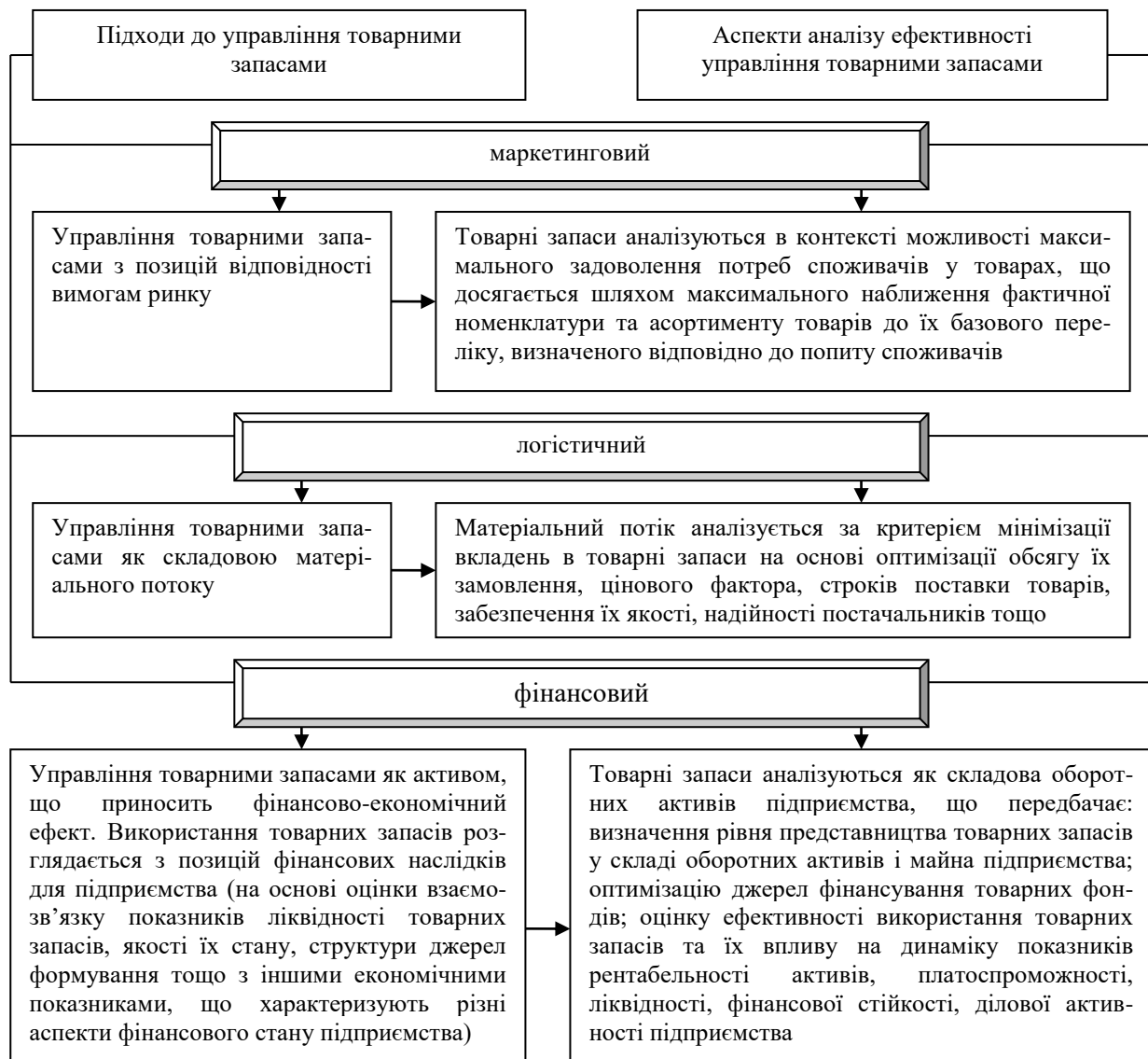
Рис. 1. Взаємозв'язок аспектів комплексного аналізу із сучасними підходами до управління товарними запасами

На основі запропонованого вище підходу може бути побудована загальна модель комплексного аналізу ефективності управління товарними запасами на підприємствах роздрібно́ї торгівлі (рис. 2).