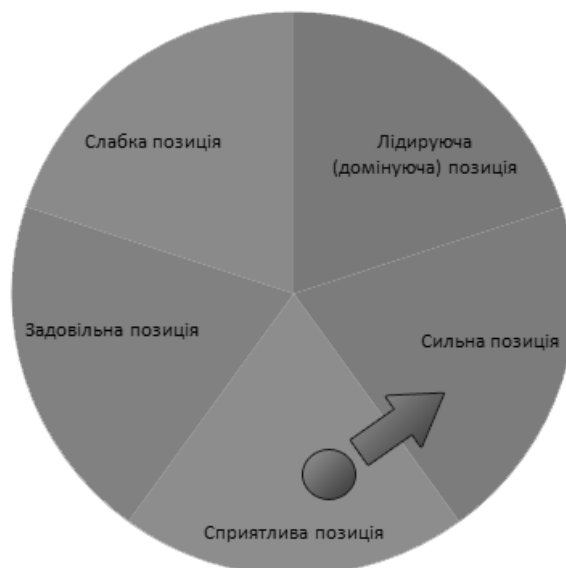
Рис. 1. Стратегічна позиція підприємства

Оскільки ТЗОВ «Хмельницький комбінат хлібопродуктів» знаходиться в сприятливій стратегічній позиції (рис. 1), то для підприємства можна було б застосувати функціональну стратегію, аби дізнатись чи зможе підприємство перейти з однієї позиції до іншої.