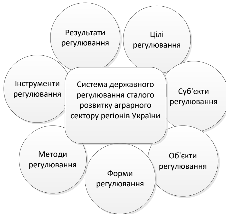
Рис. 2. Структурні елементи регулювання сталого розвитку аграрного сектору регіонів України

Відзначимо, що постійний розвиток різних економічних процесів вимагає посиленої уваги до забезпечення ефективності процесу державного регулювання сталого розвитку аграрного сектору регіонів України задля виконання поставлених стратегічних завдань. Однак, вагомих результатів структурних зрушень у діяльності сільськогосподарських суб'єктів в останні роки, на жаль, не вдається досягти. Зазначене обумовлюється тим, що процес функціонування галузі проходить в ускладнених не лише економічних, а й політичних умовах. У фокусі нестабільності основним базовим інструментом активізації діяльності сільськогосподарської галузі в умовах сталого розвитку є забезпечення її ефективного (результативного) державного регулювання, яке вимагає систематизації всіх складових елементів. Визначені елементи системи державного регулювання сталого розвитку аграрного сектору регіонів України наведені на рис.2.