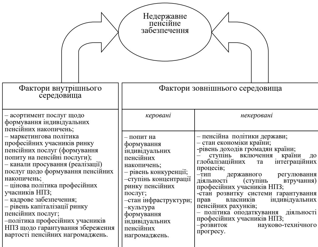
Рис. 2. Групування факторів впливу на стан та функціонування недержавного пенсійного забезпечення