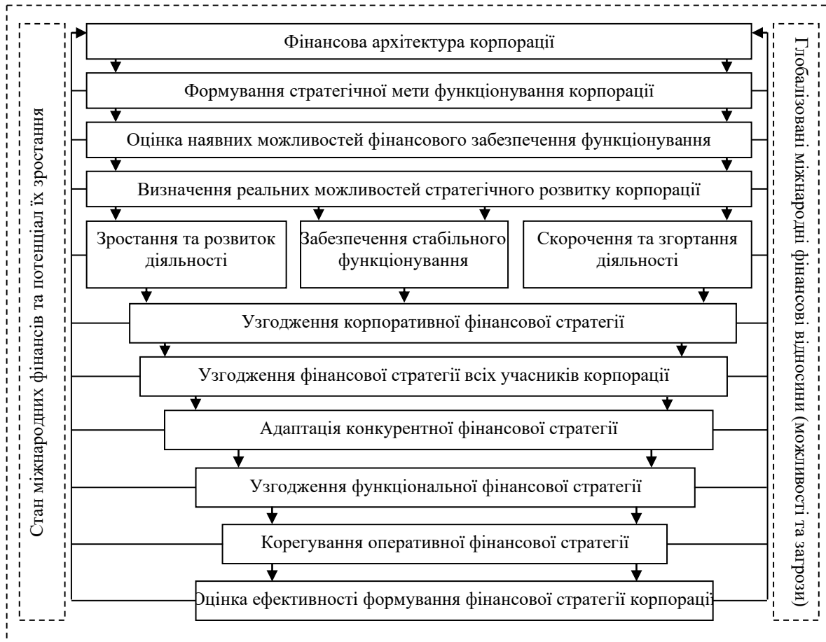
Рис. 1. Процес побудови фінансової архітектури корпорації*

формування такої моделі дозволяє створити належний рівень фінансово-економічної безпеки цих підприємств. Проте на сьогодні в теоретичній та методологічній площині окреслені питання досліджені недостатньо. Саме тому проведемо аналіз взаємозв'язку між фінансовою архітектурою корпорацій та рівнем їх безпечного та стабільного функціонування в досить мінливому сучасному економічному просторі. Цілком погоджуємося з позицією О. Яременко, яка зауважує, що «фінансова безпека підприємства є стрижнем його економічної безпеки, оскільки забезпечує стійкість функціонування усієї економічної системи» [10]. Таким чином, спочатку конкретизуємо сутність категорії «фінансова безпека суб'єкта господарювання».