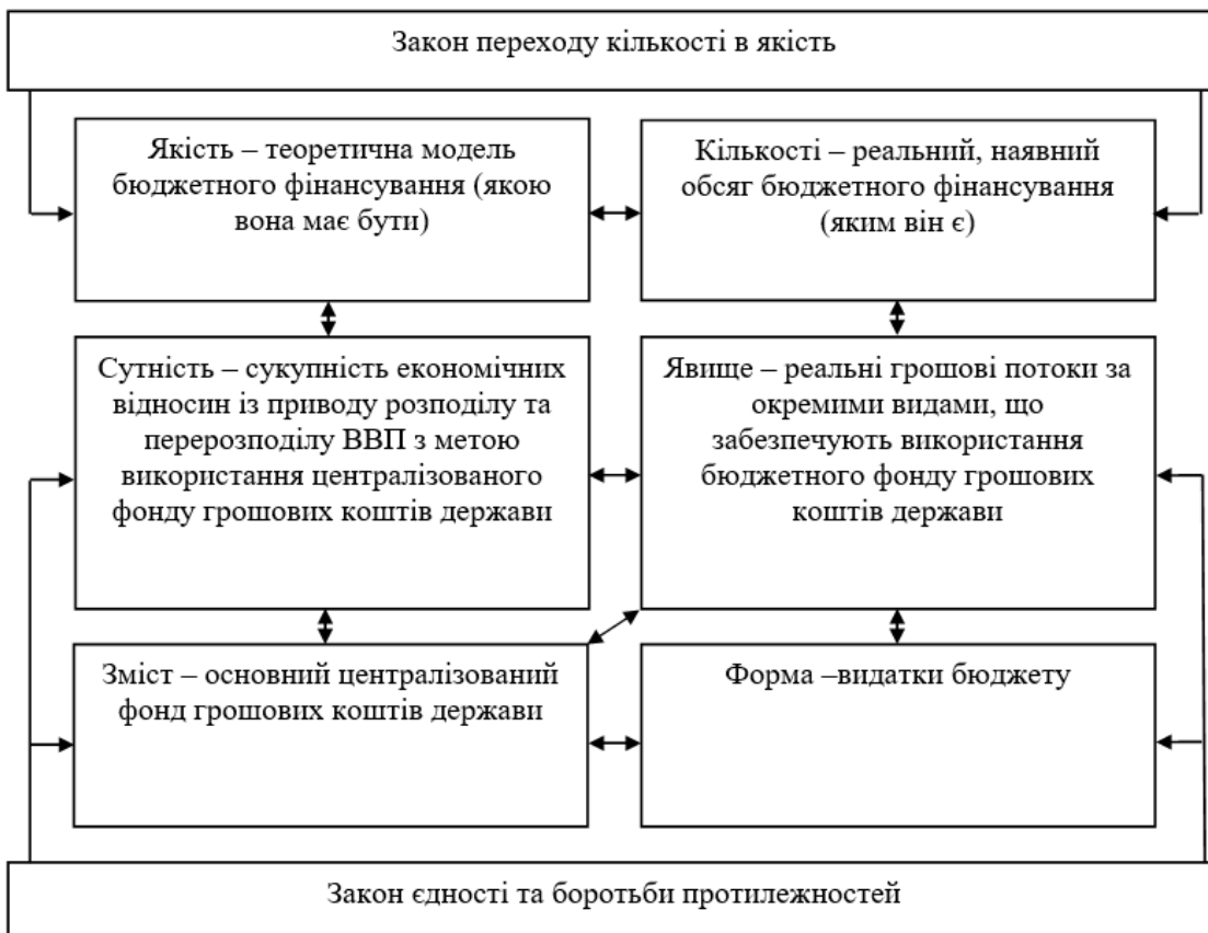
Рис. 2. Взаємозв'язок філософських категорій при дослідженні теоретичних засад бюджетного фінансування

По суті, якісна характеристика бюджету свідчить про теоретичну модель бюджету, а кількісна – про реальну. Реальна модель базована на теоретичній, переходячи з якості в кількість, а теоретична – на реальній, переходячи з кількості в якість. Єдність кількісної і якісної сторін бюджетного фінансування постає як міра. Тому зміст діалектичного закону переходу кількості у якість полягає в тому, що бюджетне фінансування містить відповідне співвідношення кількісних і якісних характеристик у межах певної міри (рис. 2).