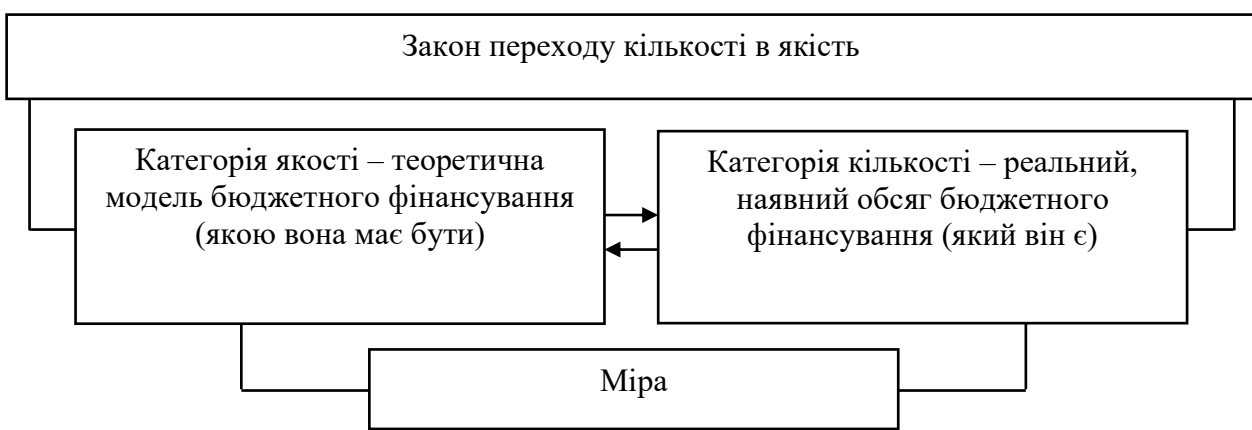
Рис. 1. Співвідношення між кількісними та якісними характеристиками бюджетного фінансування

Ми вважаємо, що взаємозв'язок між кількісною і якісною сторонами бюджетного фінансування полягає в тому, що вони, з одного боку, відмінні між собою, а з іншого – здатні переходити одна в одну. Якість є проявом бюджетних видатків саме такими, якими вони є безпосередньо і чим відрізняються від інших фондів грошових коштів суспільства. Кількісні характеристики бюджетного фінансування та відмінності його обсягів від величини інших грошових фондів відображають категорію кількості. Якість переходить у кількість тому, що межі, які виникли у бюджетному фінансуванні при завершенні цього процесу, є такими, що їх відокремлюють і поєднують.