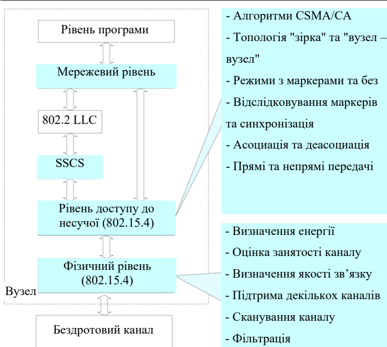
Рис. 2. Структура компонентів моделі LR-WPAN NS-2

Спочатку NS-2 підтримував моделювання тільки статичних комп'ютерних мереж TCP/IP. Проте зараз мобільні вузли підтримуються, що дозволяє моделювати мобільні мережі ad-hoc. Підтримуються протоколи маршрутизації ad-hoc AODV, DSDV, DSR і TORA, але вони вимагають доопрацювання для коректної роботи з мобільними вузлами.