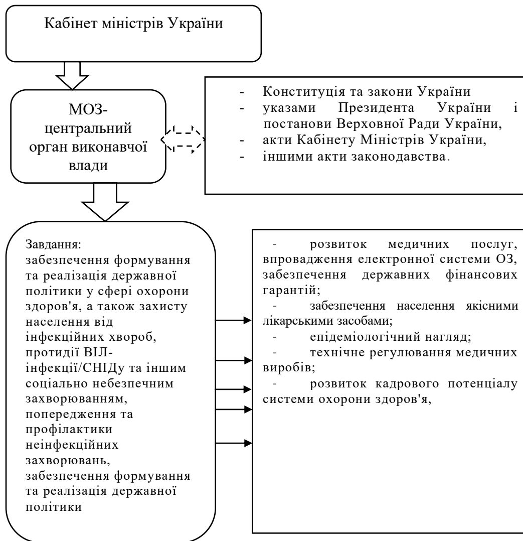
Рис.2. Функціонування МОЗ

Висновок. З вищерозглянутого матеріалу, можемо зробити висновок, що спостерігається позитивна тенденція реформування системи охорони здоров'я, проте слід виділити такі недоліки: недостатню увагу приділено спеціалізованій та екстреній медичній допомозі, фінансування електронної системи охорони здоров'я залишається недостатнім, відсутнє повне покриття закладів охорони здоров'я країни медичними інформаційними системами. Для усунення названих недоліків необхідно переглянути систему фінансування системи охорони здоров'я, в тому числі удосконалити тарифну сітку на надання та оплату послуг згідно з реальними витратами (розробка гібридної моделі фінансування з залученням страхових компаній), проводити постійне інформування та роз'яснення кроків реформи медичним працівникам.