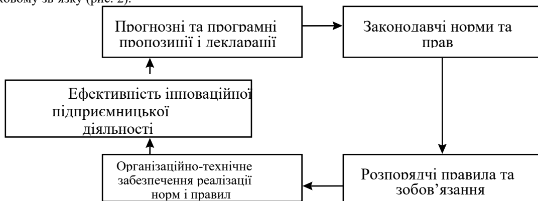
Рис. 2. Взаємозв'язок механізмів соціально-економічних мотивацій інноваційних підприємницьких структур

При розробці цих механізмів передусім слід враховувати те, що вони перебувають у причинно-наслідковому зв'язку (рис. 2).