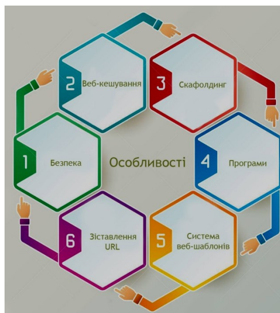
Рис. 2. Особливості веб-фреймворків.

Важливого значення набувають особливості фреймворків, основні з них подані на рис.2, які роблять їх багатофункціональними і зручними на практиці.