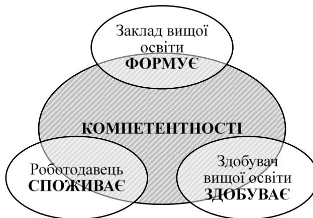
Рис. 1. Зв'язок між закладами вищої освіти, здобувачами вищої освіти і роботодавцями