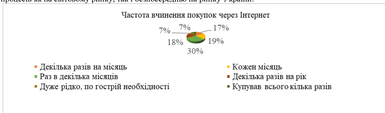
Рис. 3. Частота онлайн-замовлень в Україні, % [5]

Інновації є невід'ємною частиною електронної торгівлі. Імплементация соціальних медіа (Facebook, Instagram, Snapchat), системи онлайн-платежів (Apple Pay, PayPal, Stripe і Google Wallet), а також мобільних додатків (Uber, Nike, The New York Times, il Molino, Domino's, Ecolines, Нова Пошта) в електронну торгівлю оптимізують процес як для продавців, так і для покупців, подвоюючи обсяги купівлі-продажів. Використання таких новітніх інструментів, як чат-боти, голосовий помічник і технології віртуальної реальності (3D-сайту) формують нові форми комунікації між продавцем та покупцем, а також моделі бізнес-процесів як на світовому ринку, так і безпосередньо на ринку України.