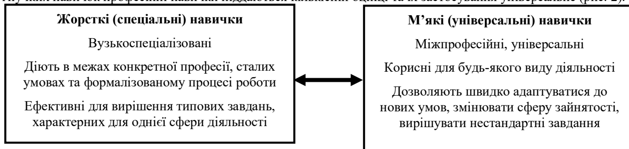
Рис. 2. Характеристика універсальних та вузькопрофесійних навичок

Soft skills – в перекладі з англ. м'які або гнучкі навички, часто називають навичками XXI століття, оскільки включають широкий набір навичок, трудових звичок та рис характеру, які мають вирішальне значення для успіху в сучасному світі, особливо в сучасній кар'єрі. Hard skills – в перекладі з англ. важкі або жорсткі навички – це специфічні навчальні здібності, необхідні для виконання роботи. На відміну від гнучких навичок професійні навички піддаються кількісній оцінці та їх застосування універсальне (рис. 2).