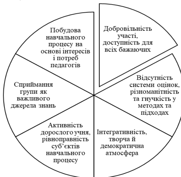
Рис. 1. Основні ознаки неформальної освіти

Сектор неформальної громадянської освіти дуже різноманітний (рис. 1): щотижневий дискусійний клуб, акція, яка звертає увагу населення на соціальні проблеми, соціальні проекти, різноманітні платформи для тренування громадянської активності, та дає можливість здобувати величезний досвід соціальної взаємодії в команді, з партнерами, з оточенням, сприяє розвитку таких умінь і якостей, як робота в команді, тайм-менеджмент, вміння боротися зі стресом, розв'язувати конфлікти, домовлятися, тобто це можливість розвитку соціальних компетенцій.