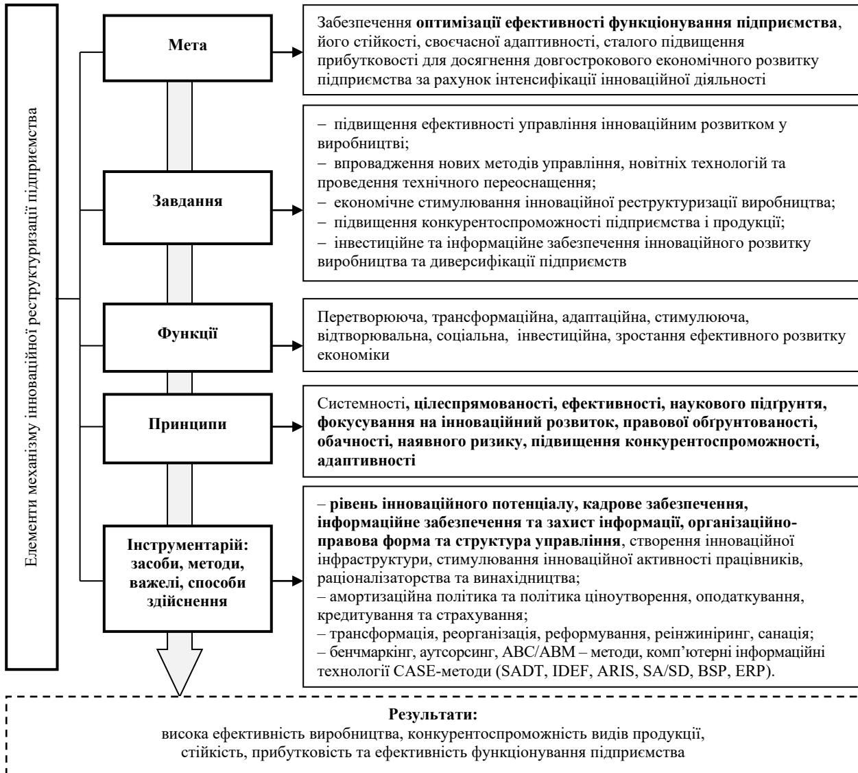
Рис. 2. Елементи механізму інноваційної реструктуризації підприємства

Виходячи із запропонованого нами підходу до трактування економічної сутності категорії «інноваційна реструктуризація підприємства», можна обґрунтувати комплекс характеристик процесу реструктуризації суб'єкта господарювання та виділити такі елементи механізму інноваційної реструктуризації підприємства (рис. 2): суб'єкти та об'єкти; мета та цілі; завдання; функції; сукупність принципів; інструментарій (засоби, методи, важелі, способи здійснення).