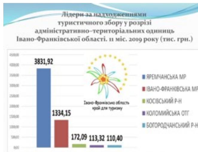
Рис. 4. Лідери на надходженнями туристичного збору у розрізі адміністративно-територіальних одиниць [13]

“Відвідай Івано-Франківськ” – це безкоштовний додаток з картою міста, інформацією про місцеві історичні визначні пам'ятки, культурно-мистецькі пейзажі, транспортну систему, готелі, пункти харчування, розважальні та торгові центри, а також контакти для аварійних служб, готелів та консульствами. Мобільний додаток – це не просто чудовий інструмент, що пропонує мандрівникам інтерактивну екскурсію містом, а й зручний путівник для місцевих жителів, оскільки він накопичує контактні дані всіх відділів мерії, інформацію про постанови, прийняті міською радою, та надсилає сповіщення про готовність документів, замовлених у центрі адміністративних послуг. Крім того, у відповідь на популярний запит додаток має окремий розділ із адресами місць розташування банкоматів міста та аптечних магазинів [18].