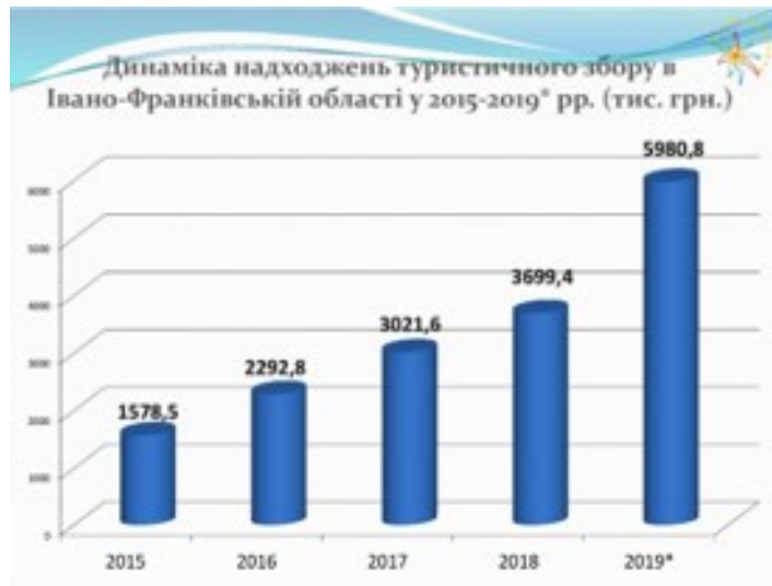
Рис. 3. Динаміка надходжень туристичного збору [13]

кишеньковим посібником, який завантажило понад 10000 осіб. Він був розроблений в рамках проекту „Розумний туризм в Івано-Франківську”, що фінансується Канадою з глобальних справ через Фонд підтримки демократичного врядування та розвитку в рамках проекту PLEDDG, здійснюється Федерацією канадських муніципалітетів. Додаток накопичує всю необхідну інформацію про місто як для туристів, так і для вихідців з Івано-Франківська.