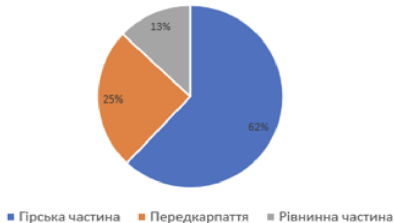
Рис. 1. Фізико-географічне районування заповідних об'єктів Івано-Франківщини [11]

Щодо фізико-географічного районування заповідних об'єктів Івано-Франківщини, які сприяють розвитку активного туризму в області, більшість із них (62 %) знаходиться у гірській частині, 25 % – у Передкарпатті та 13 % – у рівнинній частині (рис. 1). А структуру територій та об'єктів природно-заповідного фонду Івано-Франківської області за кількістю (шт.) відображено на рис. 2.