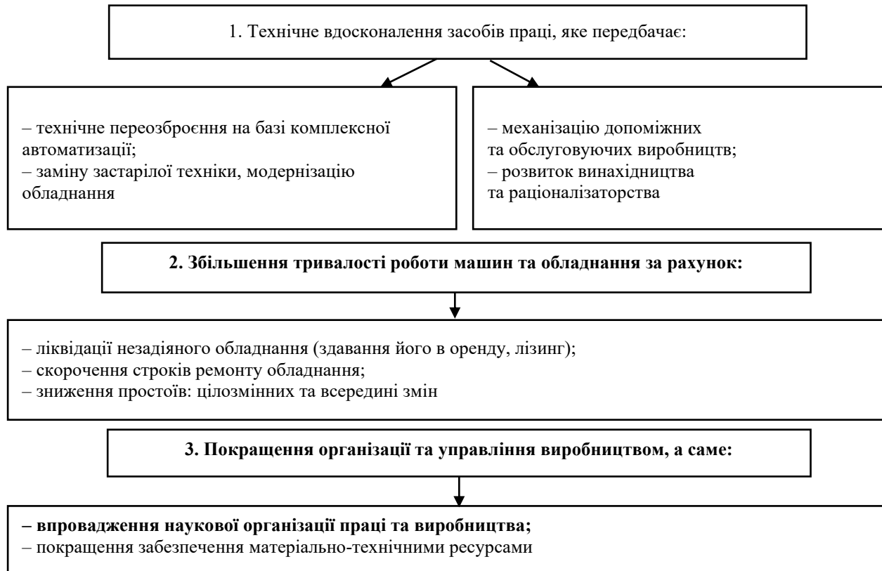
Рис. 3. Шляхи покращення ефективності використання основних засобів

Розглянемо шляхи покращення ефективності використання основних засобів ПрАТ «Прилуцький Хлібозавод», яке представлено на рис. 3.