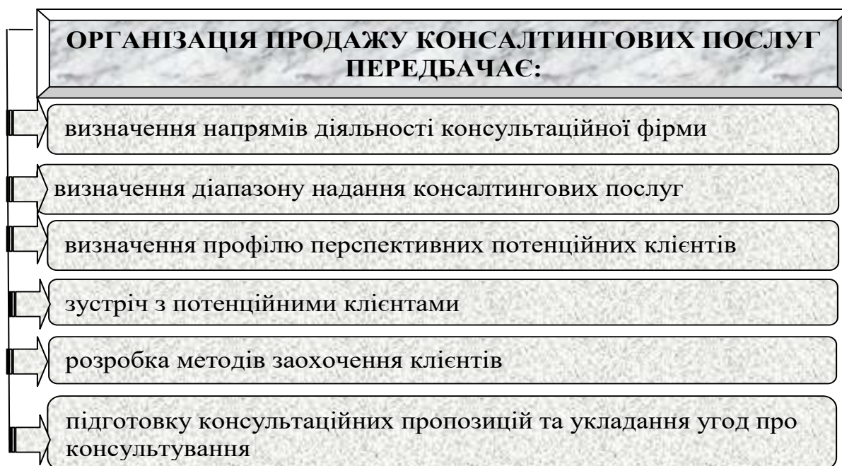
Рис. 2. Організація продажу консалтингових послуг

Розглянемо організацію продажу консалтингових послуг рис. 4