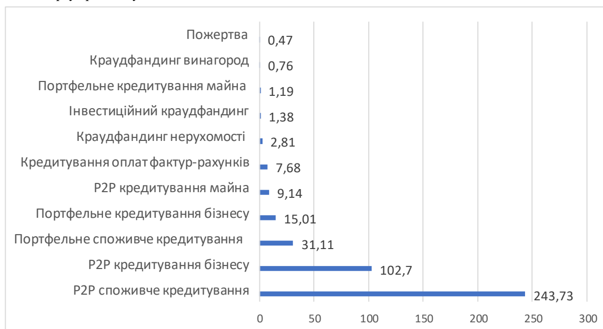
Рис. 2. Моделі краудфінансування на глобальному ринку у 2017 р. за обсягом фінансування (у млрд. дол. США) Джерело: сформовано на основі [22]

На рис. 2 представлено обсяги фінансування на глобальному ринку краудфінансування у 2017 р. за моделями краудфінансування.