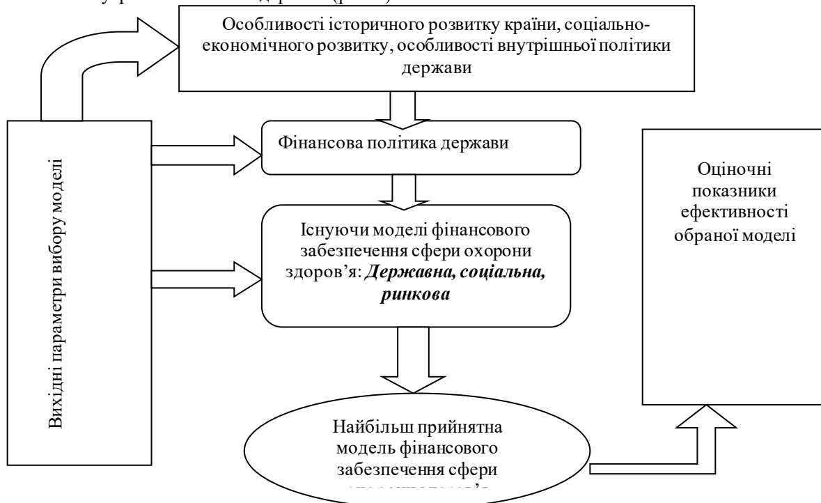
Рис. 1. Вибір моделі фінансування сфери охорони здоров'я

Ефективність функціонування сфери охорони здоров'я обумовлюється вибором моделі її фінансового забезпечення. Важливим аспектом ефективності фінансової моделі є розподіл відповідальності між її ключовими учасниками. Вихідними параметрами вибору моделі фінансового забезпечення розвитку сфери охорони здоров'я є особливості історичного розвитку країни, соціально-економічного розвитку, особливості внутрішньої політики держави (рис. 1).