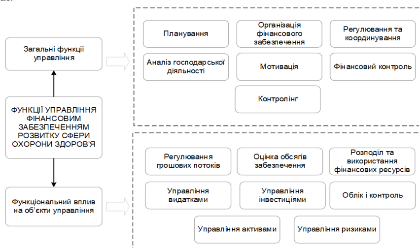
Рис. 2. Функціональний підхід до управління фінансовим забезпеченням розвитку сфери охорони здоров'я *

При формуванні державної політики у сфері охорони здоров'я враховуються наступні чинники: розробка обґрунтованої концепції (на основі аналізу ситуації, вимог економічних законів, потреб населення), визначення основних напрямів використання ресурсів, визначення переліку дій для реалізації мети (з урахуванням економічної політики, міжнародних вимог). Також держава виконує стратегічне та тактичне планування. Як надавачі так і замовники медичних послуг беруть участь в розробці та прийнятті фінансових рішень. Участь держави в управлінні фінансами охорони здоров'я пов'язана з упередженням можливого спричинення шкоди отримувачам медичних послуг, контролем якості та доступності медичних послуг всім категоріям населення, формуванням інститутів захисту прав пацієнтів та медичних працівників, удосконаленню нормативно-правового забезпечення, сприяння впровадження в практику нових форм та методів лікування.