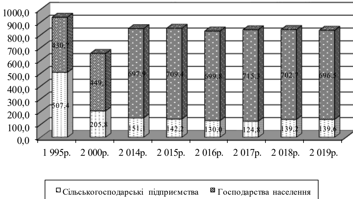
Рис. 2. Динаміка процесу сегментації ринку молока у Вінницькій області, тис. т