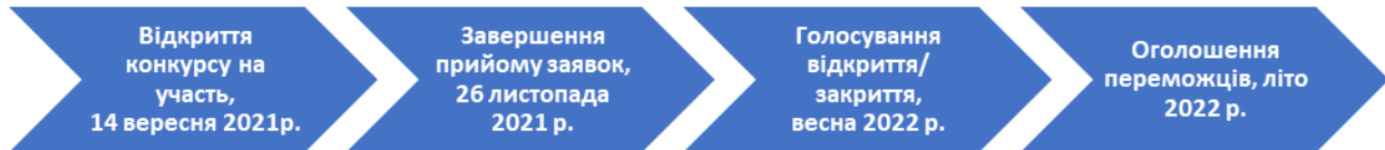
Рис. 3. Процес вибору кращих звітів CR Reporting Awards у 2022 році

Кожен звіт зареєстрований на даному сайті [5] і доступний англійською мовою, може стати переможцем. Виборцями є 66 тис. зареєстрованих користувачів корпоративного реєстру. Дана онлайн-спільнота є глобальною аудиторією кваліфікованих зацікавлених сторін і користувачів соціальних звітів: корпоративних фахівців з соціальної відповідальності, консультантів, державних установ, інвесторів, аналітиків, громадських організацій, благодійних організацій, журналістів, науковців та студентів. Виборці можуть переглядати свій вибір, змінювати свою думку та переглядати подальші звіти до закриття голосування. Працівники компаній-учасників не мають права голосувати за звіт свого підприємства. Кожен користувач може проголосувати за п'ять звітів у кожній категорії в порядку надання переваги. Найкращі звіти обирають десяти номінаціях. Окрім того, обирають не лиш кращий звіт, але і два призові місця у кожній із номінацій. Фактично усі номінації поділено на дві групи: перша група - тип звіту та організація та друга - аспекти прозорості. Цікавим є і той факт, один звіт може перемагати у кількох номінаціях. На рис. 3 представлено процес вибору кращих звітів зі сталого розвитку CR Reporting Awards у 2022 році.