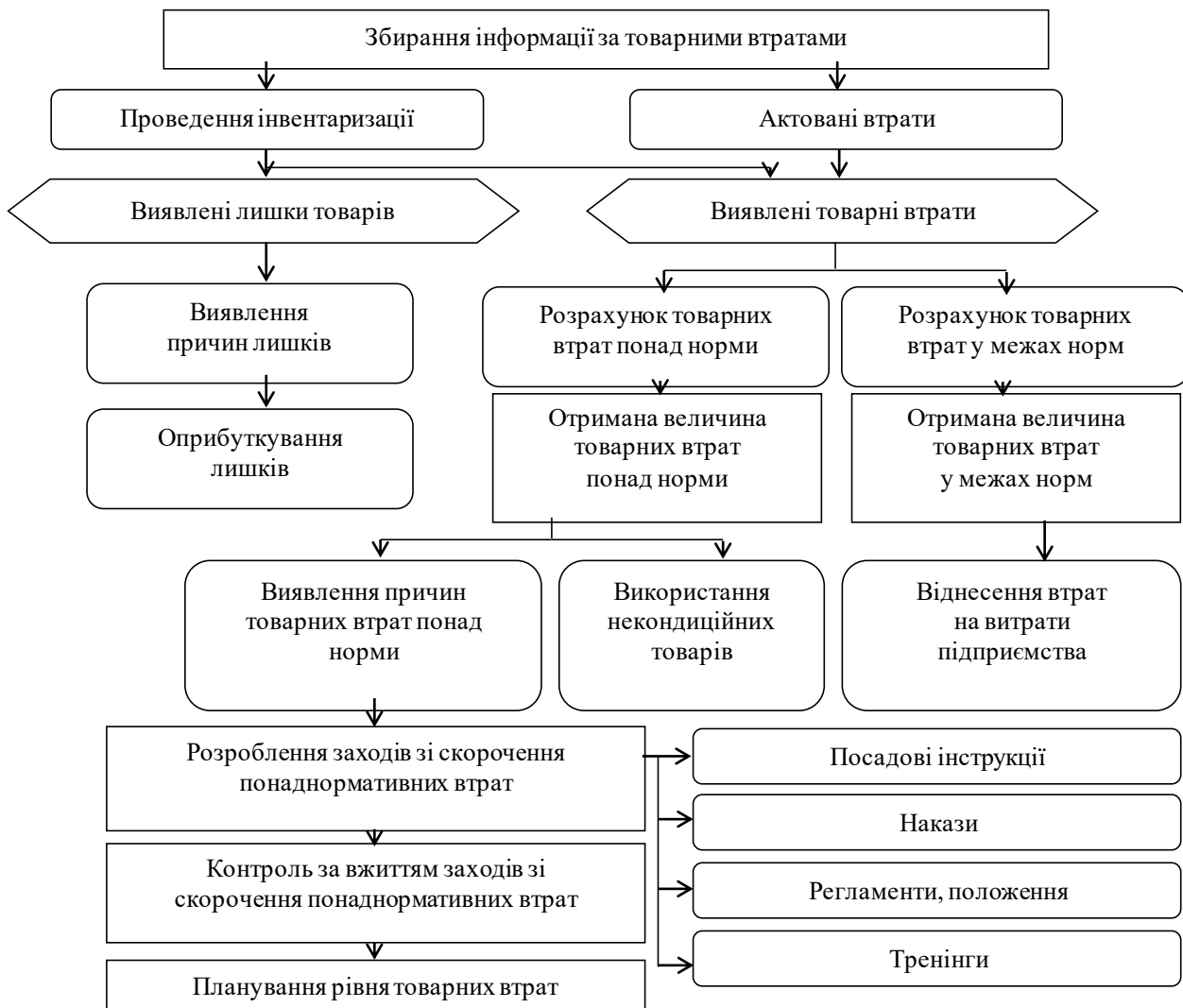
Рис. 3. Структурно-логічна схема, покладена в основу регламенту системи внутрішнього контролю товарних втрат у торговельних мережах [7]

Неабияку роль в удосконаленні системи обліку лікарських засобів на підприємстві фармацевтичної галузі відіграє розробка заходів щодо регулювання втрат та зменшення їх кількості, адже медичні препарати – це специфічна ланка товарів, які повинні мати не менше 2/3 строку придатності під час їх реалізації, а отже повинна проводитись систематична перевірка. Під час приймання товарів може бути виявлена нестача або пересортиця. Це все має бути оформлено відповідними документами, а задля полегшеного ведення обліку втрат необхідно притримуватись певної схеми, яка допоможе систематизувати такі перевірки. Приклад збирання інформації за товарними втратами наведений на рисунку 3.