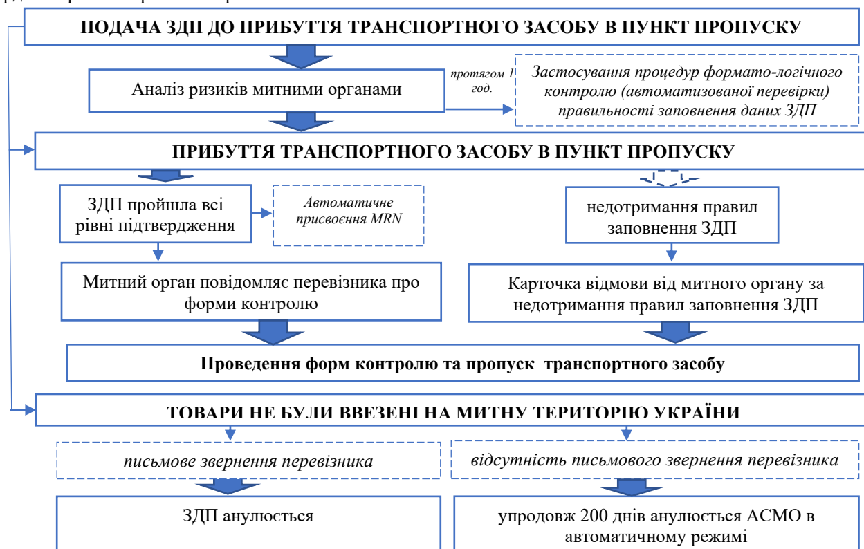
Рис. 3. Структурно-логічна схема процедури пропуску вантажу через митний кордон України із застосування ЗДП

Після отримання митними органами ЗДП реєструється автоматизованою системою митного оформлення (далі – АСМО) в автоматичному режимі. Схематично процедуру пропуску через митний кордон України зображено на рис. 3.