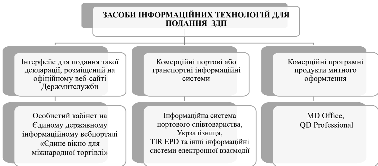
Рис. 2. Засоби інформаційних технологій для подання митним органам ЗДП

Передача ЗДП здійснюється засобами інформаційних технологій, зокрема через кабінет користувача або через АРІ інтерфейс для подачі з різних систем за умови забезпечення ними відправки документу у встановлені строки (рис. 2). Можливість подання ЗДП в паперовому вигляді не передбачена митним законодавством.