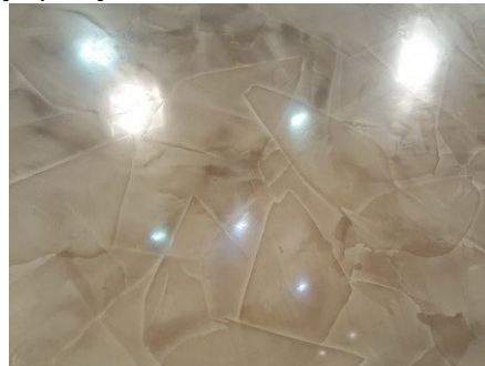
Рис. 2. Мінеральна декоративна штукатурка SAN MARKO

Синтетична інтер'єрна, мінеральна штукатурка KANALHADE (Рис. 1) імітує неполірований граніт з дзеркальними вкрапленнями. За рахунок особливої міцності і довговічності, такі покриття використовуються в громадських місцях, офісах, ресторанах.