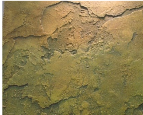
Рис. 4. Фактурна штукатурка з ефектами

Штукатурка з ефектом імітації цементу KONTRET ART включає до свого складу акрил – силіконові полімери. Основне використання - імітація поверхонь без вкраплення щєбінь, цемент, пісок. Використовується успішно як всередині так і зовні будівлі.