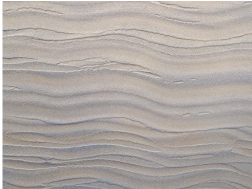
Рис. 3. Рідка та піноподібна штукатурка