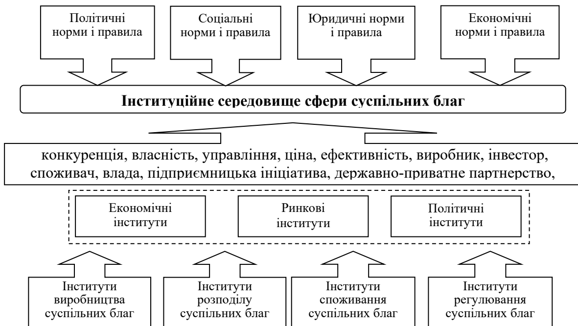
Рис. 2. Модель інституційного середовища суспільних благ у національній економіці

Інституційне середовище суспільних благ можна визначити як сукупність взаємопов'язаних основоположних політичних, соціальних, юридичних, економічних норм і правил (рис. 2), що визначає умови їх створення, розподілу, споживання, та основним його призначенням є об'єднання суспільних зусиль для задоволення колективних потреб, вирішення «провалів ринку» на основі принципу оптимальності по Парето, збалансування індивідуальних інтересів та соціальної відповідальності, принципу компенсації. Базовими інститутами для забезпечення суспільних благ є влада, ринок, конкуренція, підприємництво тощо (рис. 2) та відповідні їм інституційні форми. При цьому роль того чи іншого інституту змінюється в залежності від характеристик-властивостей конкретного суспільного блага, ступеню їх прояву й структури зовнішніх ефектів – участь держави беззаперечна для забезпечення чистими суспільними благами і мінімальна у випадку змішаного, ринкові механізми, підприємницька здатність, державно-приватне партнерство вкрай важливі для створення та розподілу суспільного блага з низьким рівнем виключеності, а у випадку низької неконкурентності державі доцільно зосередитися на локальних суспільних благах.