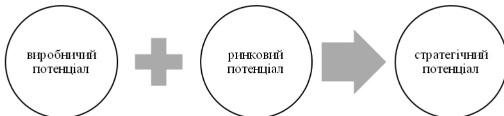
Рис. 2. Взаємодія окремих видів потенціалу підприємства

Сталою закономірністю є те, що відсутність попиту на товари чи послуги призведе до припинення існування такого суб'єкта господарювання, що підкреслює важливість ринкових можливостей та ринкового потенціалу в діяльності підприємства. В свою чергу, стратегія виступає моделлю поведінки підприємства на ринку, тому, на наш погляд, стратегічний потенціал з одного боку виступає похідною категорією ринкового потенціалу підприємства, а з іншого – описує наявність можливостей застосування сучасних інструментів управління для забезпечення ефективного функціонування та розвитку підприємства. Ринкові можливості забезпечують необхідність здійснення виробництва, оскільки ринок формує сукупний попит, що забезпечує певний рівень прибутковості підприємства.