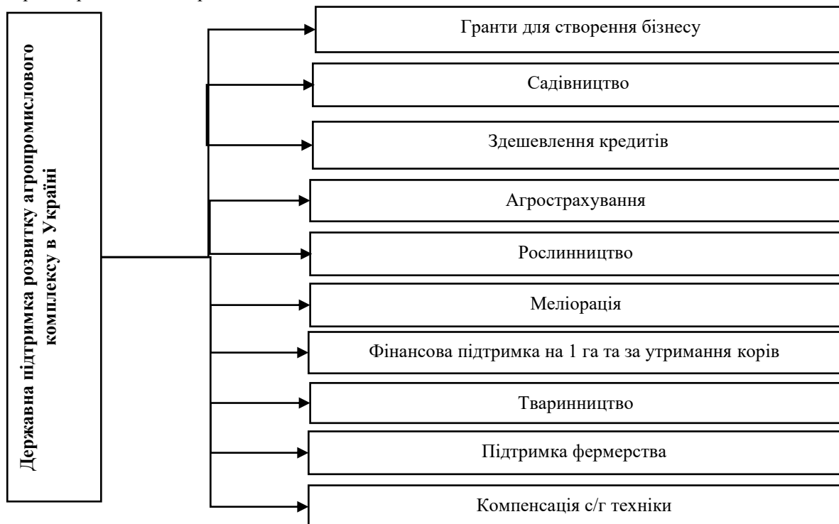
Рис. 1. Напрями державної підтримки розвитку агропромислового комплексу в Україні

В даний час питання вирішення проблем сільського господарства, а саме його розвитку і модернізації, з урахуванням впровадження нових та інноваційних технологій, залишається актуальним. Сільське господарство завжди залишається на першому місці, що стосується допомоги, що виділяється на його розвиток. Під державною підтримкою необхідно розуміти систему заходів, орієнтованих на виплату коштів з державного бюджету сільськогосподарським виробникам, які спрямовані на розвиток промисловості та сільських територій у визначених районах, так і на безпосереднє підвищення їх рентабельності за рахунок виробництва необхідної сільськогосподарської продукції, головним критерієм якого є ефективність використання цієї підтримки та спрямування на інноваційні технології розвитку агропромислового комплексу. Схему напрямів державної підтримки розвитку агропромислового комплексу в Україні представимо на рис 1.