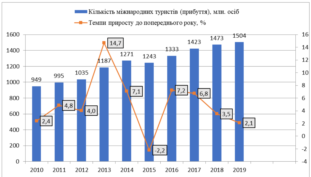
Рис. 1. Динаміка глобальних туристичних потоків