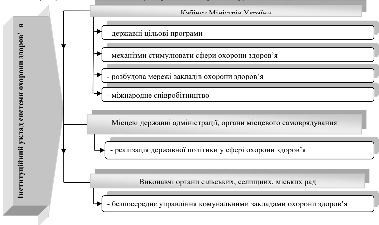
Рис. 1 Державне регулювання системи охорони здоров'я України

Отже, як зазначено на рис. 1, державні службовці (особи, уповноважені на виконання функцій держави або місцевого самоврядування) [5] усіх рівнів мають прямий та безпосередній вплив на діяльність системи охорони здоров'я, в тому числі на прийняття управлінських рішень, що впливають на ефективність діяльності усіх учасників системи та можуть призвести до проявів корупції.