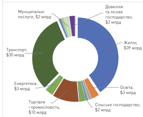
Рис. 1. Повний обсяг завданої Україні шкоди станом на 1 червня 2022 року в загальному розмірі $97 мільярдів [15]

Світовий банк та Європейська комісія підтвердили свою незмінну підтримку Уряду України. Враховуючи триваючу війну, виникне потреба в майбутніх оцінках шкоди, втрат і потреб у реконструкції/відновленні в Україні. Швейцарський державний секретаріат з економічних питань (SECO) надав фінансову підтримку для цієї мети. Враховуючи наслідки війни з 24 лютого по 1 червня 2022 року, збитки, завдані галузями, охопленими RDNA, оцінюються приблизно в 97 мільярдів доларів США (рис. 1). Найбільше постраждали такі сфери, як житловий сектор (40% від загального збитку), транспорт (31%) і торгівля і промисловість (10%).