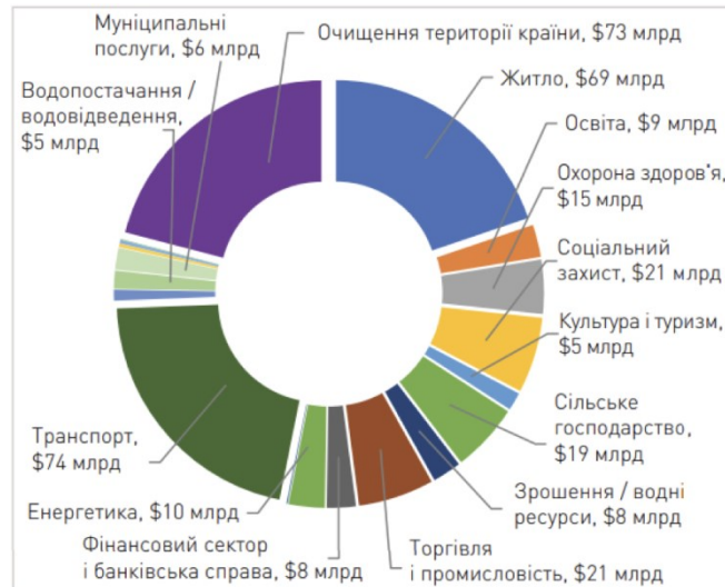
Рис. 2. Повний обсяг потреб України станом на 1 червня 2022 року в загальному розмірі $349 мільярдів [15]

З найближчої та короткострокової перспективи (в наступні 18-36 місяців), щоб задовольнити найнагальніші потреби в аналізованих галузях, знадобиться понад 105 мільярдів доларів. До них належать термінові потреби, а саме: