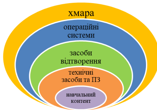
Рис. 1. Компоненти VR/AR для e-learning

Візуалізація навчального контенту під час різних видів занять дозволяє відтворити та деталізувати складні технологічні процеси, які відбуваються в реальному світі без ризиків для всіх учасників навчального процесу.