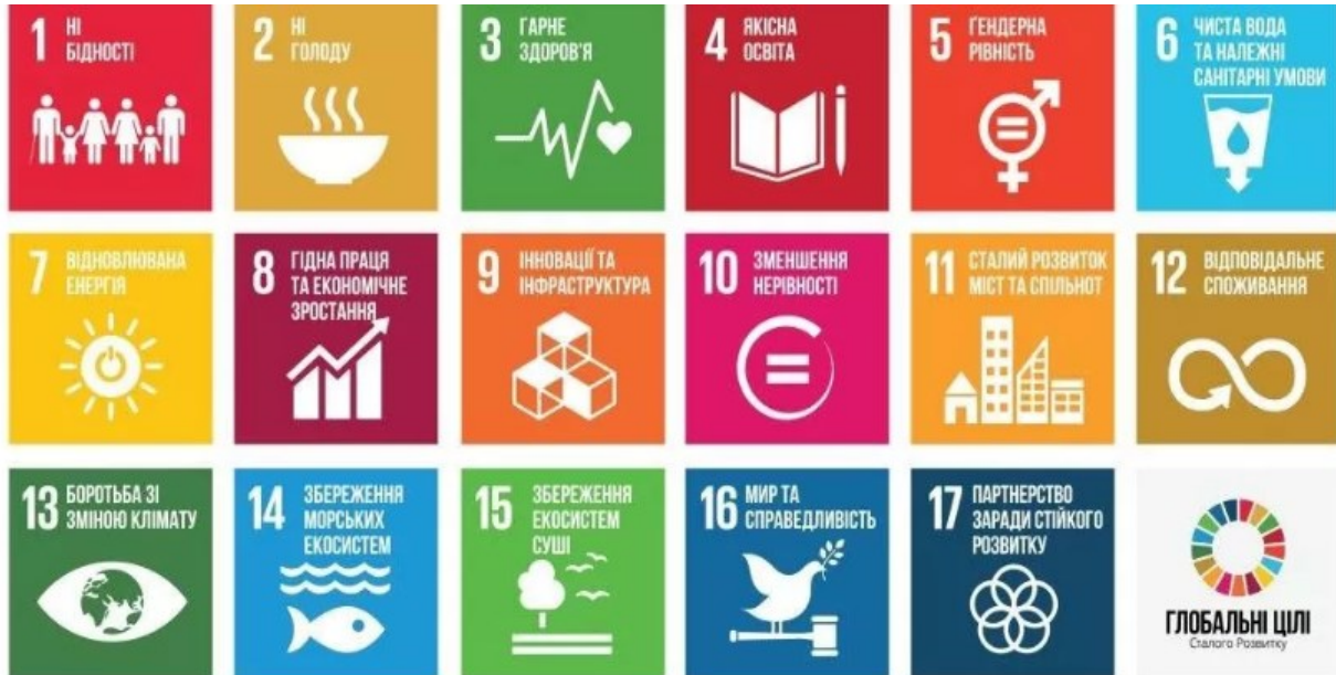
Рис. 2. Цілі сталого розвитку

Сталый розвиток визначається як розвиток, який задовольняє поточні потреби людей, не погіршуючи можливостей майбутніх поколінь задовольняти їх власні потреби. Він покликаний забезпечити баланс між економічними, соціальними і екологічними аспектами розвитку, забезпечуючи збереження природних ресурсів та охорону довкілля. Сталый розвиток визначає 17 Цілей (рис. 2).