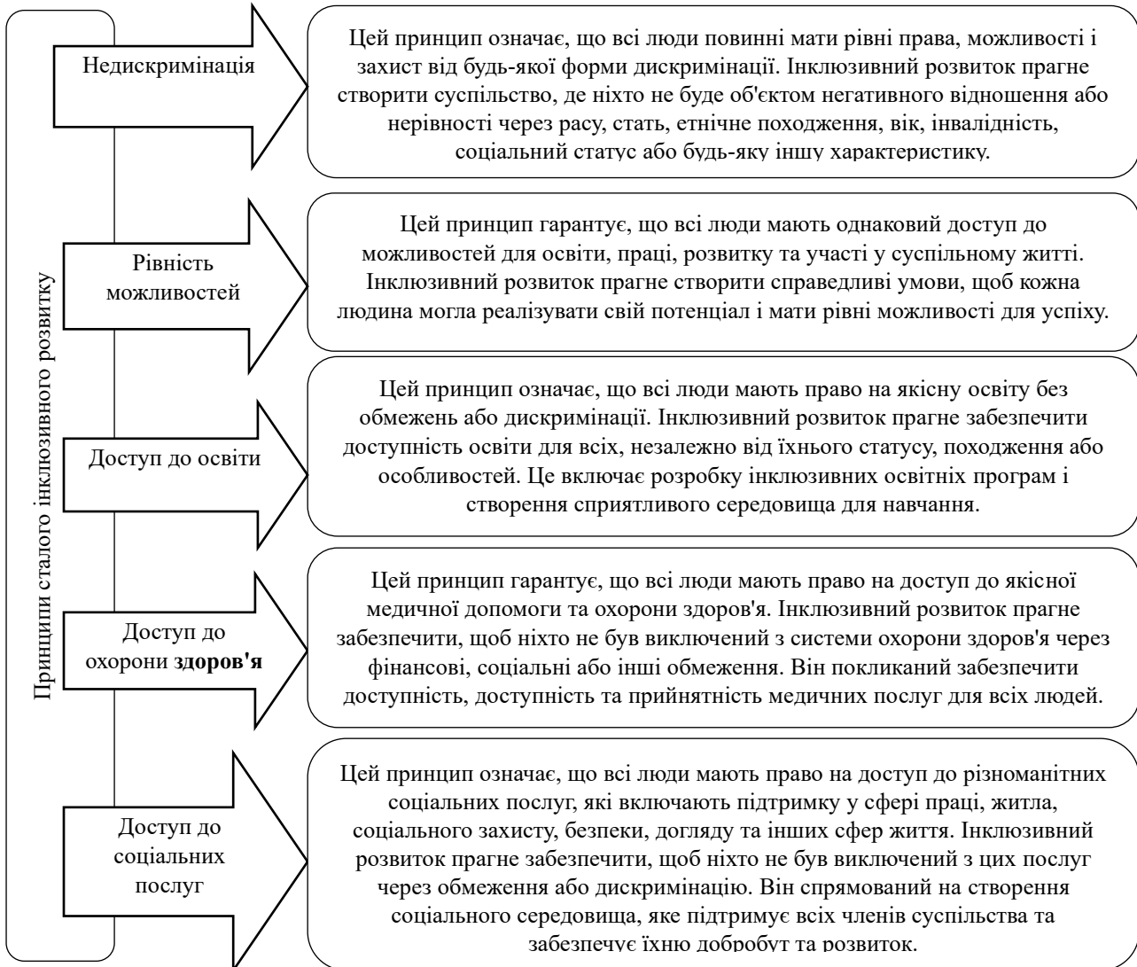
Рис. 3. Принципи сталого інклюзивного розвитку

Основними принципами сталого інклюзивного розвитку можливо визначити: недискримінація, рівність можливостей, доступ до освіти, охорони здоров'я та соціальних послуг (рис. 3). Це означає, що кожна людина має право на освіту відповідного рівня, доступ до якісної медичної допомоги та можливість активної участі у суспільному житті.