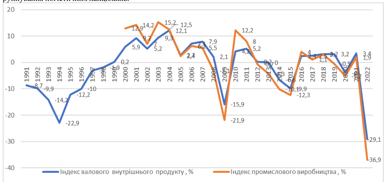
Рис. 1. Динаміка індексів валового внутрішнього продукту та промислового виробництва, %

Оцінку трендів розпочнемо з дослідження основних макроекономічних показників: індексів валового внутрішнього продукту та промислового виробництва (рис. 1); динаміки експорту, імпорту та сальдо зовнішньої торгівлі України (рис. 2). Наведені дані свідчать про те, що увесь час розвитку економіки України можна розглядати як постійну «гойдалку» спад-відновлення. Адже на рисунку 1 явно помітні чотири масштабні кризи. Така динаміка з одного боку свідчить про надзвичайно складні умови розвитку й функціонування бізнесу, з іншого – швидку адаптацію та гнучкість вітчизняних бізнес-структур. Завдяки вмінню пристосовуватись до нових умов функціонування українська економіка і в умовах війни починає поживавлюватись, не зважаючи на пошкодження критичної інфраструктури, виробничих потужностей та руйнування логістичних ланцюжків.