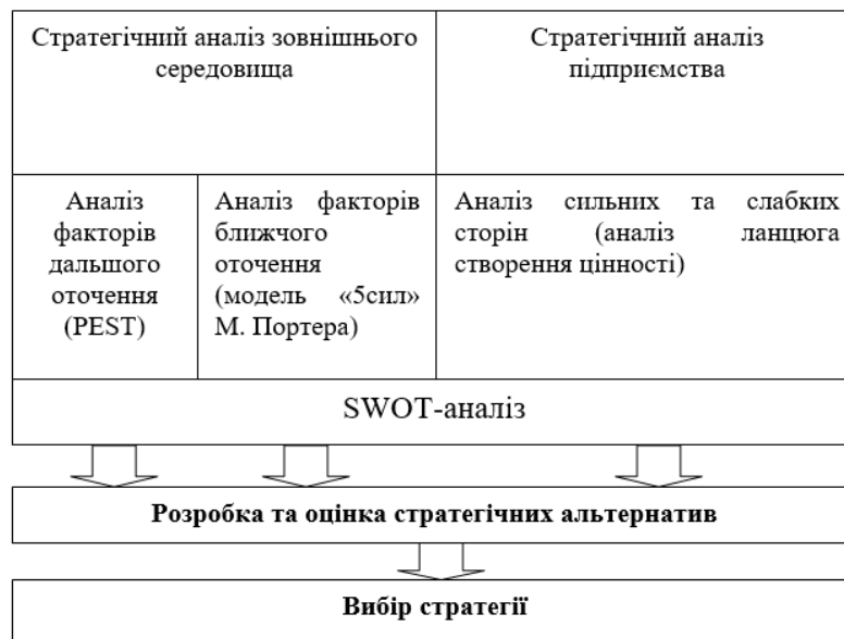
Рис. 2 Модель розроблення стратегії для сільськогосподарських підприємств

Особливість формування стратегії сільськогосподарських підприємств можна у наступному вигляді (рис 2).