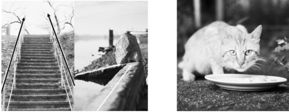
Рис. 4. Приклад використання правил ведучих ліній та заповнення на фотографіях

Шосте правило композиції в фотографії полягає в фотографуванні двох площин будівлі. Це правило рекомендує не обмежуватись однією перспективою фотографування, а намагатись показати різні сторони та площини архітектурної споруди (рис. 5). Замість того, щоб фотографувати будівлю прямо з фронту, можна використати інші кути та ракурси, щоб надати зображенню більшої цікавості та глибини. Фотографування двох площин будівлі дає можливість створити візуальну гру та динаміку, розкриваючи різні аспекти архітектури. Це правило допомагає підкреслити унікальність та характер будівлі, а також розширити можливості виразності та креативності фотографії