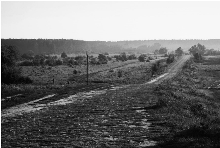
Рис. 2. Приклад використання правила плановості на фотографії

Цей ефект досягається шляхом розташування головного об'єкта всередині уявної або реальної рамки, яка слугує засобом виділення об'єкту або створення закритої композиції, що змінює сприйняття зображення у бік обмеженості. На зображенні, зазначеному на рис. 3, фреймінг досягається за допомогою людей, які стоять спиною до нас. Вони утворюють рамку, яка виокремлює головний об'єкт або просто створює відчуття закритої композиції. Застосування фреймінгу в фотографії додає цікавості та глибини зображенню. Застосування правила фреймінгу є ефективним способом створення цікавих та естетично привабливих зображень, які привертають увагу глядача та викликають його інтерес до головного об'єкту.