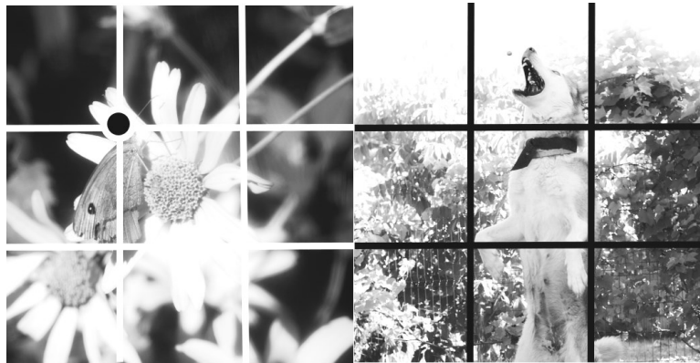
Рис. 1. Використання правила третин у туристичних фотографіях (зліва – вірно, справа – ні)

Плановість є ще одним важливим елементом композиції у фотографії. Вона допомагає створити відчуття глибини та об'ємності у зображенні, що робить фотографії цікавими та привабливими для глядачів. У фотографії, плановість може бути досягнута за допомогою розташування об'єктів у різних планах - передньому, середньому та задньому. Лінії, які розділяють ці плани, відокремлюють їх один від одного. Найближчий до спостерігача план є переднім, тоді як найвіддаленіший план - задній. Ця структура планів додає глибину та об'ємність зображенню.